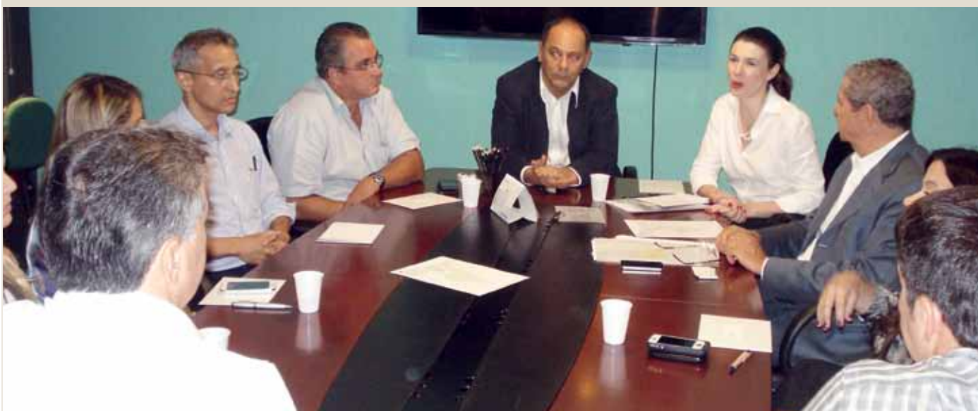
Durante reunião, empresários analisaram metas para a Convenção Coletiva

REUNIÕES ENTRE PATRÕES E EMPREGADOS DEVEM COMEÇAR DEPOIS DA SEMANA SANTA