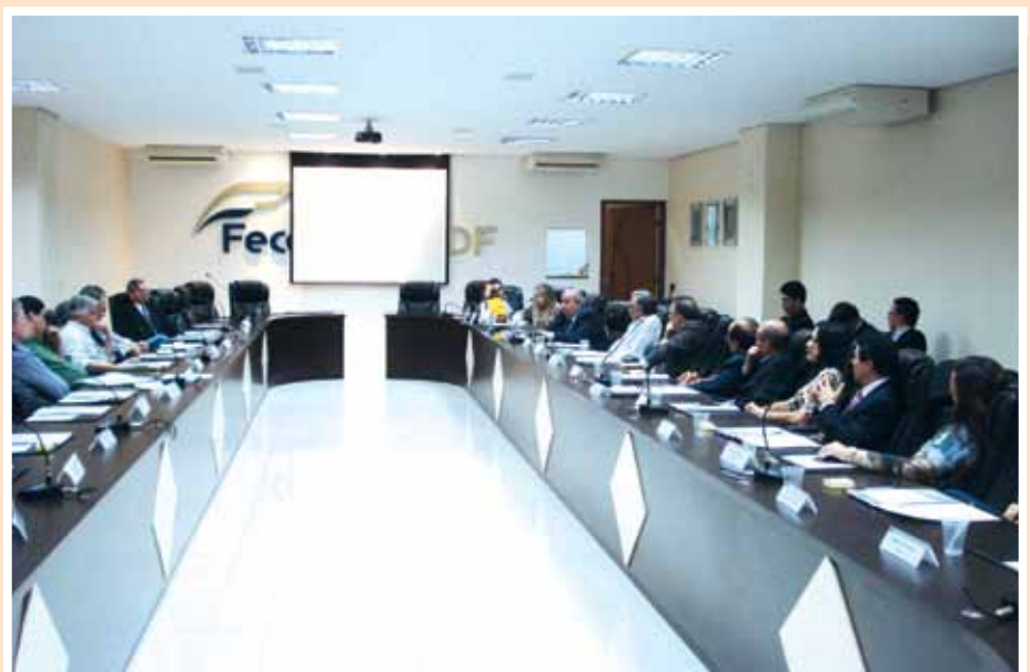
Nova diretoria do Sindivarejista reuniu-se no auditório da Federação do Comércio, quando foram anunciados planos para dinamizar o setor