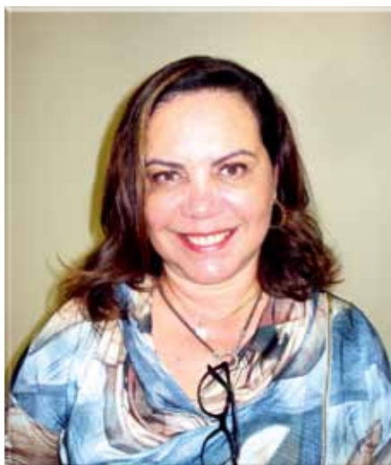
Bernardeth espera que Novacap solucione drama dos lojistas

de maior movimento. Dias depois da reunião, varejistas do Jardim Botânico foram recebidos pela diretoria da Novacap.