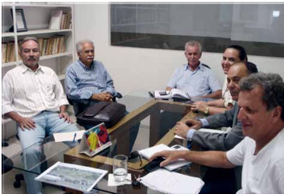
Lojistas do Jardim Botânico expuseram ao presidente do Sindivarejista os problemas causados pela falta de estacionamento. GDF promete solução

Enquanto isso, muitos carros são multados e as vendas vêm caindo notadamente entre quinta-feira e sábado, dias