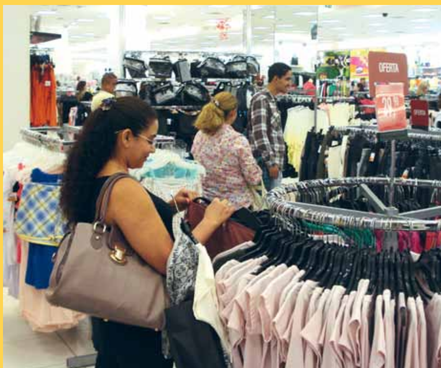
Com a Copa do Mundo, comércio espera vender mais. Balcão de Empregos do Sindivarejista abriu inscrições para quem pretende trabalhar

O comércio situado nas imediações do estádio Mané Garrincha é quem mais deve contratar.