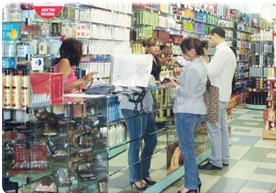
Na hora de pagar as compras, consumidores receberão nota fiscal explicando os impostos recolhidos pelo governo

O governo federal oficializou a prorrogação – válida até junho de 2014 – do prazo para o início da fiscalização às empresas que não detalhem nas notas e cupons fiscais os impostos cobrados na venda de bens e serviços. Decorrido o prazo de 12 meses, o descumprimento da Lei 12.741/12, que trata do detalhamento dos impostos, sujeitará o infrator às sanções previstas no Código de Defesa do Consumidor.