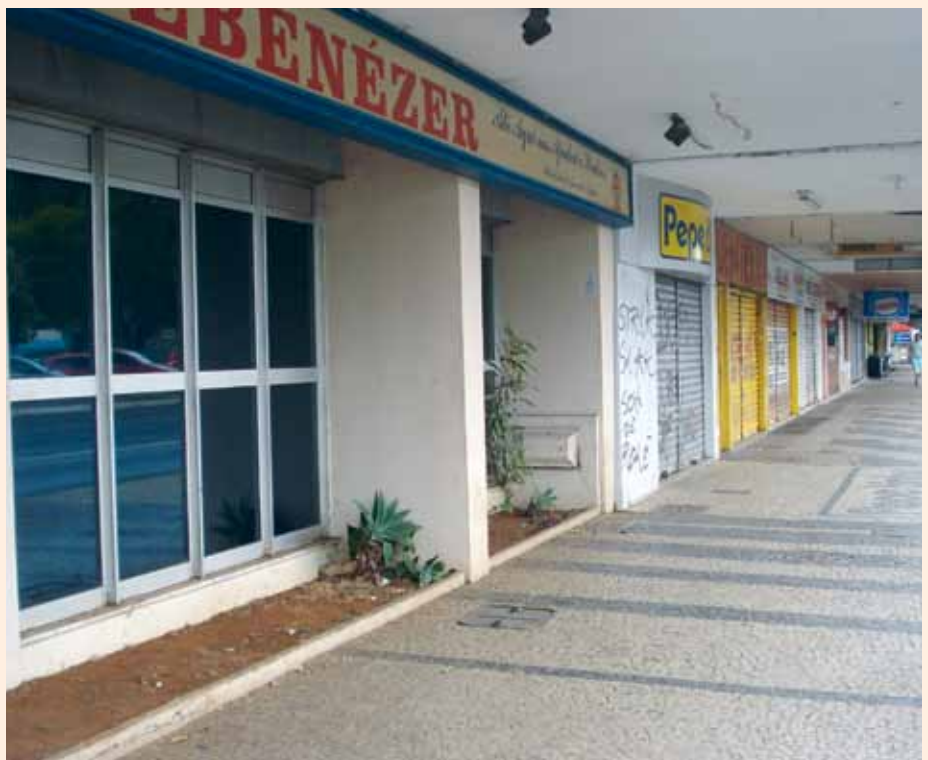
Concebida para ser um cartão postal de Brasília, a W3 Sul tem hoje mais de 90 lojas fechadas e outras transformadas em templos religiosos e cursos