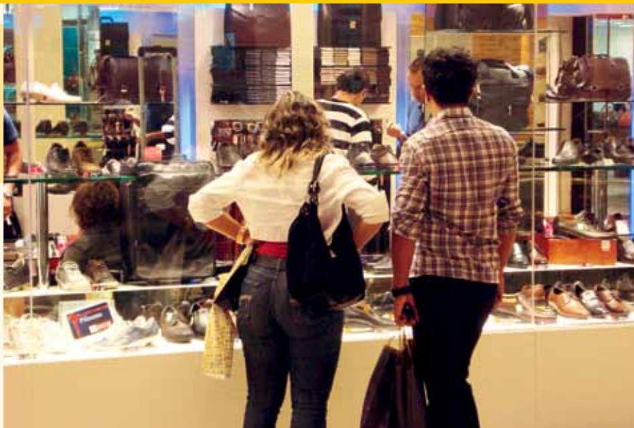
Diretoria do Sindivarejista vai propor medidas para impulsionar as vendas nas lojas de rua e de shoppings. Ações visam desenvolver a economia

“Visamos sempre o desenvolvimento da economia e a