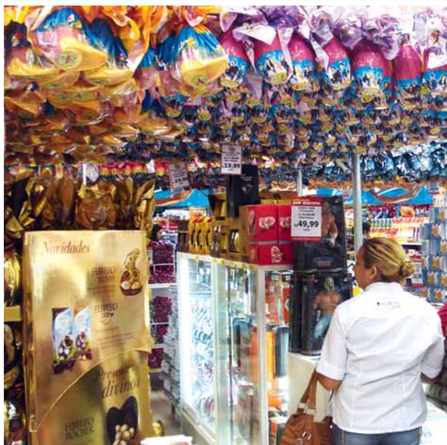
Lojas utilizam ovos de páscoa como decoração bem colorida e facilitam formas de pagamento. Aumento nas vendas deve ser de 4%

Estima-se que 1.500.000 ovos sejam vendidos no DF este ano. Muitos consumidores compram mais de 20 ovos para presentear.